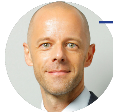
LVMH Responsable Environnement Groupe Group Environment Senior Manager