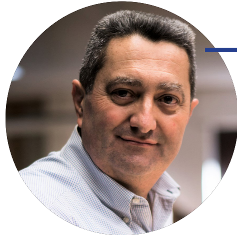
Groupe SATURNE Maisons Fortier et Masure Directeur Général CEO