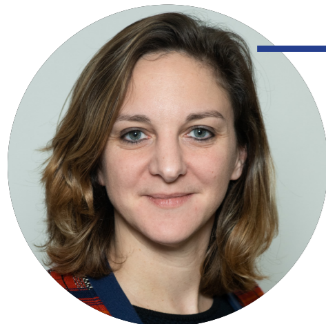
AFNOR Responsable Environnement et Economie circulaire Environment & Circular Economy Manager