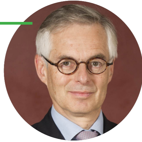
HERMES Directeur Général du Pôle Artisanal Maroquinerie-Sellerie Managing Director of the Artisanal Leather goods and saddlery section

The Hermès Group's ambition for sustainable development is to contribute to the longevity of its craftsmanship model by enhancing the value of its heritage and to enable virtuous economic and social development, not only for employees and shareholders, but more broadly for its stakeholders, and thus contribute to the future for the next generations. To achieve this objective, the Hermès Group must also control and reduce its impacts, however moderate, on the planet. This goal is also accompanied by a deep humanistic desire to give back to the world some of what the world has given to Hermès.