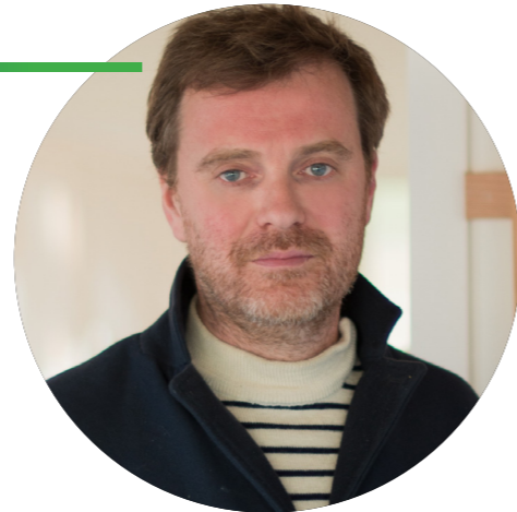
Bleu de Chauffe Créateur et dirigeant de la marque Creator and manager of the brand